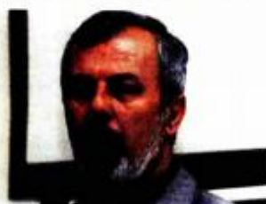
ANTE SANADER, ŽUPAN SPLITSKO-DALMATINSKI:

- Imate dobre razvojne potencijale u ICT sektoru i u maloj brodogradnji. Iskoristite mogućnosti koje vam pružaju dobri softveraši, tehnološki centri i stručni klasteri